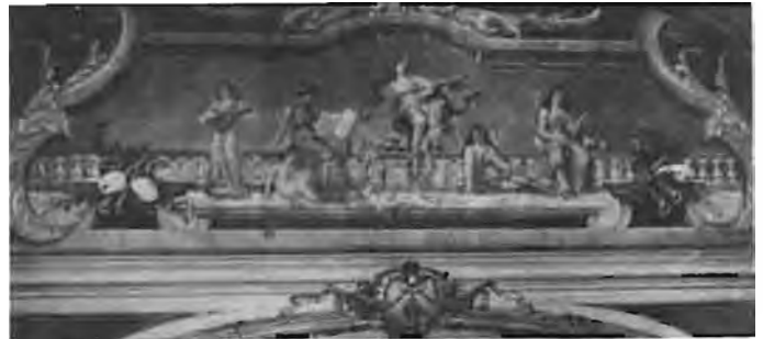
Hierdie muurskildery reg bokant die verhoog is 'n sprekende voorbeeld van die aandag wat aan die detail en afwerking van die teater bestee is.

Ingange vanaf die teater na die aangrensende Grand-hotel het toegang verleen tot sitkamers en kroë, terwyl verversings bedien is op die balkon wat die hele fasade van die twee geboue beslaan het. Die teater het sitplek aan meer as 900 toeskouers gebied en is verdeel in 'n onderverdieping, agt loges en 'n eerste en 'n tweede galery. Aangesien die teater op die krom- of stutbalkbeginsel ("cantilever principle") gebou is, was daar geen pilare in die saal nie. Nog 'n kenmerk van die gebou was die groot verhoog en die koepelvormige skuifdak, 4,5 meter in deursnee.