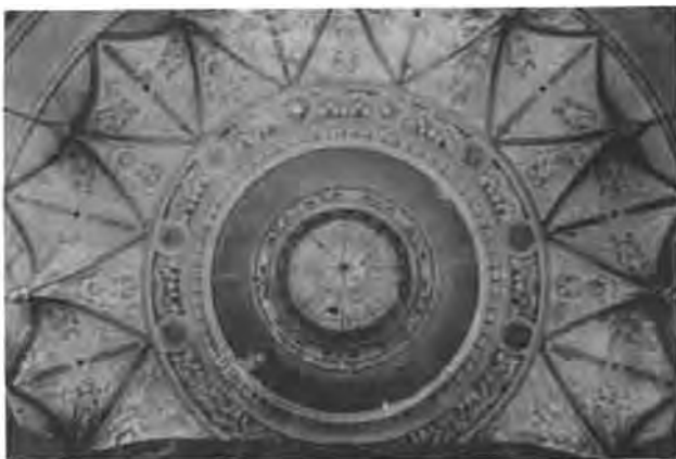
Die skuifdak en plafon met pilare wat afloop na die boonste galery, net sigbaar in die hoeke. Voorstellings van skrywers en dramaturge, afgewissel met blommotiewe het die plafon versier.

Die drieverdiepinggebou met sy lang fasade en drie koepels is deur die Belgiese argitek, E.C. Choinier, van Johannesburg ontwerp en is bestempel as een van die bes toegeruste en modernste teaters in Suid-Afrika. Oor die styleienskappe van die gebou bestaan daar uiteenlopende uitsprake wat wissel van moderne Franse Renaissance, of "a free treatment of French renaissance" tot art nouveau . Ten spyte van Désirée Picton-Seymour se onvleiende kommentaar, "altogether an awkward-looking building, the interior was no more pleasing than the exterior," moes sy tog toegee dat "any theatre of that era had a certain turn-of-century charm". Die gebou het inderdaad sjarme en grasia besit wat sprekend is van die wellewendheid van die Eduardiane era.