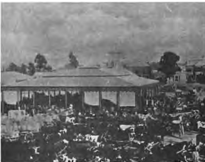
Verkeersknoep op Hoffmanplein deur waens en perdekarre