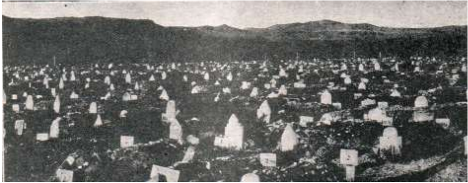
Die kampkerkhof te Bethulie – so ver soos die oog strek