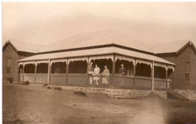
Die opstal op Cyferfontein met Kotie Grobbelaar, regs op die stoep