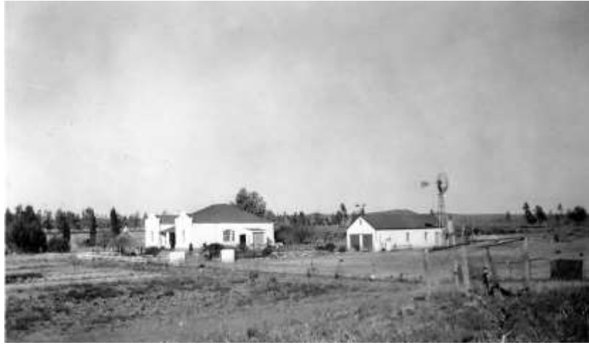
Die opstal op Kroonpost van Pieter Grobbelaar