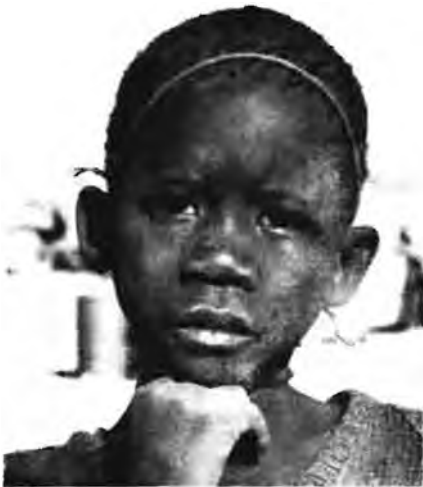
Links: 'n Dama-seuntjie van die Ugab-omgewing.

Regs: 'n Onbewoonde hut. Hierdie tipe hutte is gemaak van droë basstroke wat met 'n mengsel van sand en mis bedek word. Vandag word hierdie hutte toenemend deur vierkantige sinkstrukture vervang.