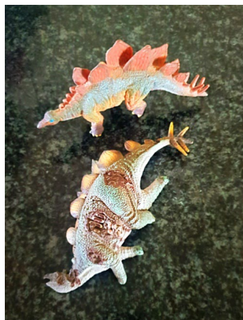
Figuur 5.1: Fotobeeld van die dooie dinosaurus wat tussen Riana en bevryding gelê het

Die dooie dinosaurus bly steeds by haar spook en verteenwoordig vir haar die “swart duiwel, die vrees en die uitsprake”. Die verandering in grootte, waar die klein akkedissie nie die groot dinosaurus kan aanval nie, het “haar kop laat oopswaai”. Sy het nog altyd geweet en onbewustelik geglo, dat die dooie dinosaurus háár verantwoordelikheid is. Sy het hom met haar saamgedra, al het sy dikwels krom geraak onder die las van dié dooie gewig. Die klein akkedis het in grootte gegroei en bo die gevaarlike dinosaurus uitgetroon. Sy kon die dooie dier met die gevange dier vervang. Dit het harde werk gekos, maar sy kon uiteindelik beheer neem.