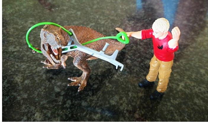
Figuur 5.2: Foto-uitbeelding van waar Riana beheer geneem het van die bedreiging in haar lewe. Die bedreiging het nie verdwyn nie, maar kon daarna anders deur Riana benader word