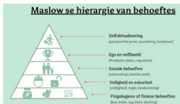
Figuur 5.3: Maslow se hiërargie van behoefte ( https://prezi.com/i/qh3gbc1jjoh6/maslow-se-hiërargie-van-behoeftes- )

Rogers (1902–1987) se persoonsgesentreerde teorie beklemtoon die strewe van die individuele mens (Rogers 1980:34; 1986:29). In hierdie bydraes probeer Rogers om die totaliteit van die mens te behou deur alle gedrag onder een oorheersende neiging in te sluit. Hierdie neiging verteenwoordig die strewe na selfaktualisering. Selfaktualisering word gebruik om die toppunt in die nastrewing van behoeftes aan te dui.