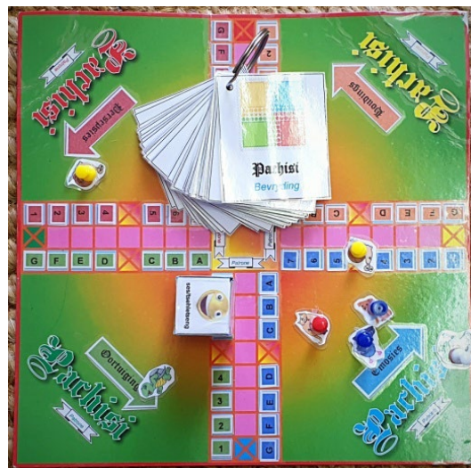
Figuur 6.4: Die spel “Pachisi” wat ontwerp is om houdings, persepsies, oortuigings, emosies en patrone te eien

Die bordspel “Pachisi” is met groot vrug gebruik om problematiese houdings, persepsies, oortuigings, emosies en patrone na vore te bring. Tydens hierdie spel is die landskap waarin die probleem bestaan, weereens uitgebrei deur vrae wat, soos aanbeveel deur Tomm (2008:174–191), in die bordspel verwerk is. Die kontekstuele invloed van die probleem is op speelse wyse verken. Ek het opnuut die roeping ontvang om, aldus Müller (2000:103) 'n situasie te fasiliteer waarin daar 'n nuwe dinamiese beweging, wat in háár lewe haalbaar is, sal plaasvind.