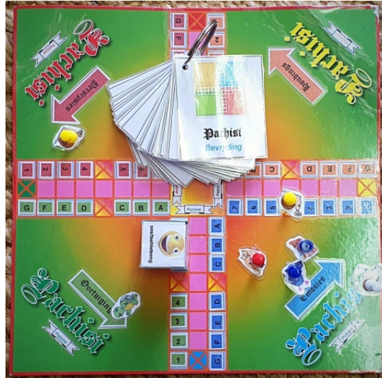
Die bordspel “Pachisi” soos op Tomm (2008:174-191) se vraelys gebaseer.