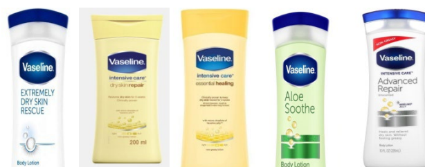
Figuur 3.1: Lyfrome soos dit vir Riana die fases van terapie verbeeld

Riana het dikwels na haar frustrasie verwys. Ek besef nou eers dat dit as ’n eksistensiële frustrasie binne die veld van die logoterapie beskou sou kon word. Soos haar voorbeelde van die lyfrome vyf verskillende fases van terapie beskryf het, kon ons vanaf “Extreme Therapy Rescue”, deur “Advanced Therapy” tot by “Intensive Care” vorder.