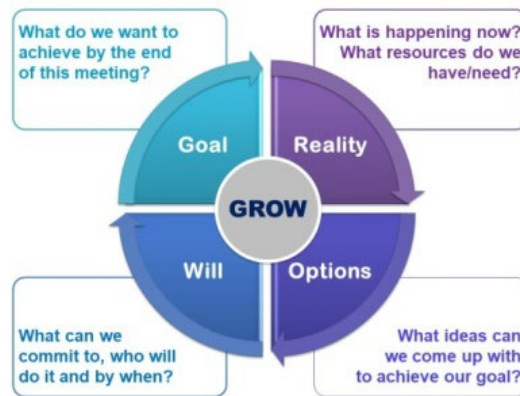
Figuur 6.1: GROW-model (Whitmore 2002)

Haar GROW-sirkel is gelamineer en word by herhaaldelik en met groot vrug en vreugde gebruik. Soos voorheen genoem, kom kreatiwiteit juis na vore “wanneer die bewustelike oordeel plek maak vir naïwiteit, speelsheid en kinderlike onskuld” (Müller 2000:65). Hierdie spelverhale is nie meer ’n tendens bokant haar sosiale vlak nie, maar vul haar met lewenskragtigheid en nuwe geestelike vitaliteit. Hierdie magiese kuns het nie haar verantwoordelikheid afgebreek nie, maar juis ’n nuwe verantwoordelikeheidsin gefasiliteer. Dit verwys ook weer na White en Epston (1990:59–60) se huidige, sowel as toekomstige, unieke uitkomst wat tot ’n nuwe sinvolheid in haar lewe kan lei.