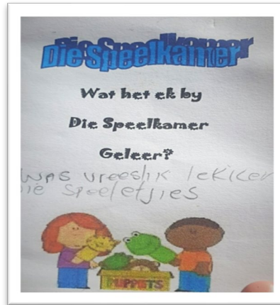
Figuur 6.3: 'n Voorbeeld van die termineringsboekie se voorblad (Addendum 11)

invloed ten opsigte van die wyse waarop uitdagende emosies erken en bestuur kan word (Blom, Read & Kind 2012:8)