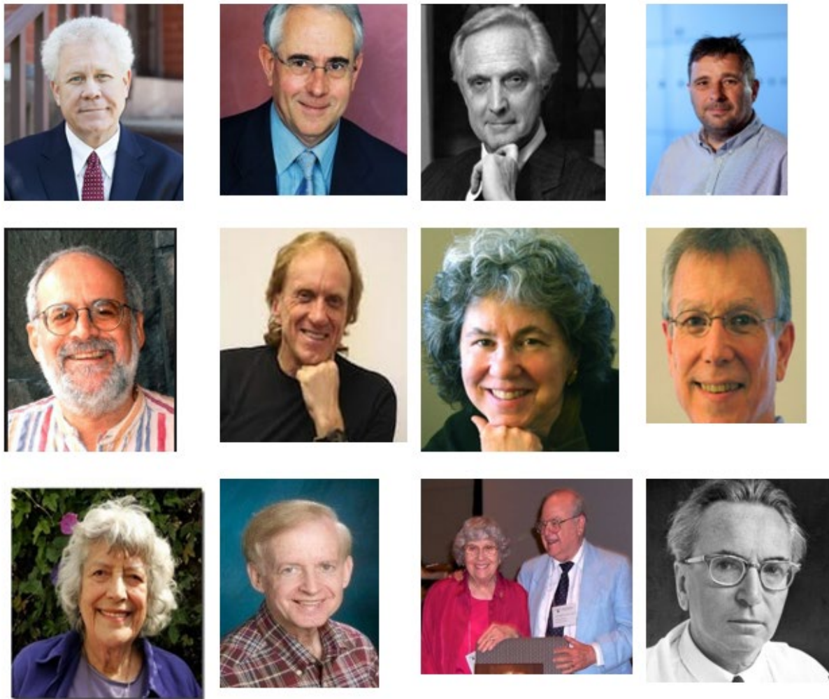
Figuur 5.4: Die 'redaksie' van spelmetodes