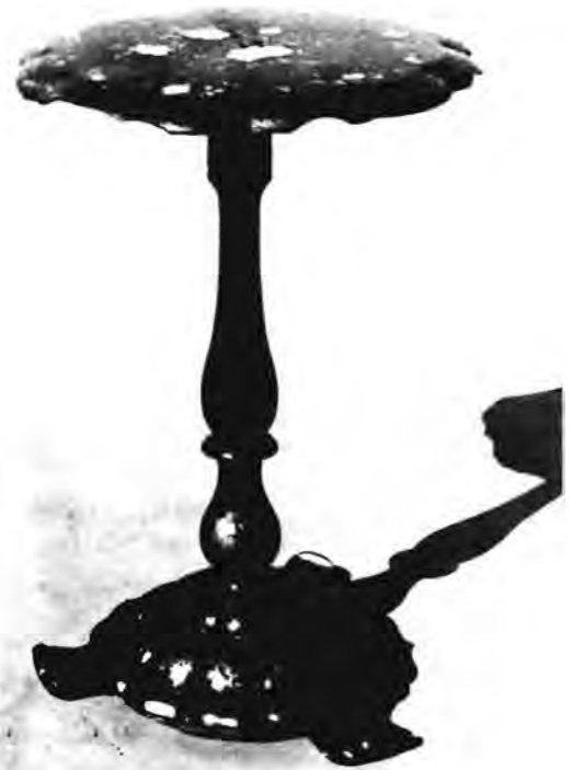
Nog meubels in die Nasionale Museum se versameling is hierdie geleentheidstafeltjie. Die blad en pote is van papier-maché. Perlemoeninlegwerk en veelkleurige blommotiewe versier die blad.