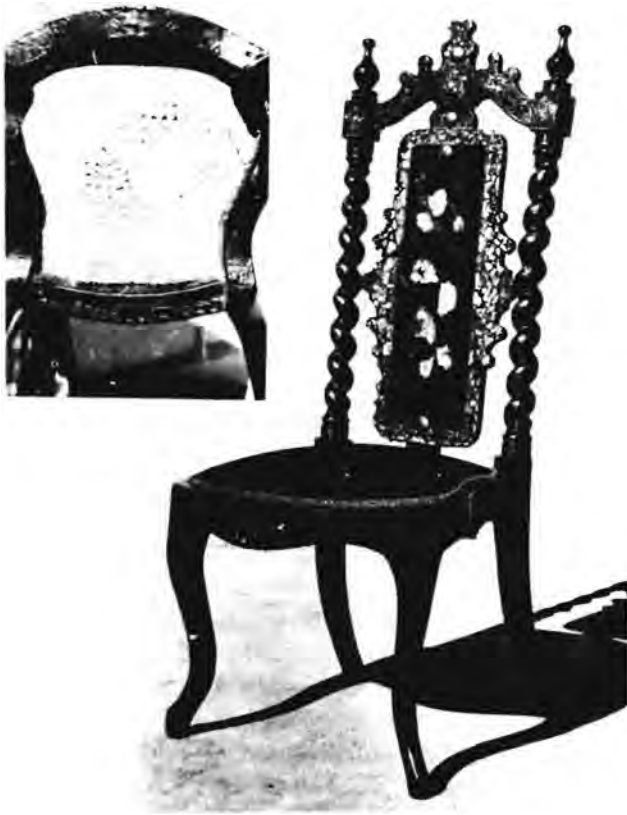
Die middelste deel van die rugleuning en ruglat van die stoel is van papier-maché. Dit is met swart vernis afgewerk. Op die spote en stoelpote is vergulde motiewe met perlemoeninlegwerk en op die rugleuning is gekleurde blommotiewe, ook met perlemoeninlegwerk. Onder die stoffering is die oorspronklike rottang sitplek.

denkbare vorm vervaardig, van die kleinste knopie tot 'n klavier.