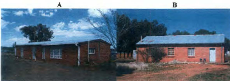
Die pastorie te Bainsvlei