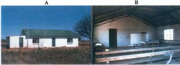
Foto 5 - Die kerkgebou van die wyk Vergezocht (Sien punt 5 op die kaart)