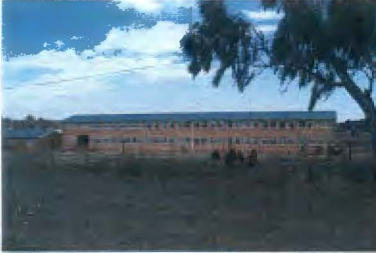
Foto A - Bainsvlei Combined School