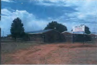
Foto B - Waterbron Public School