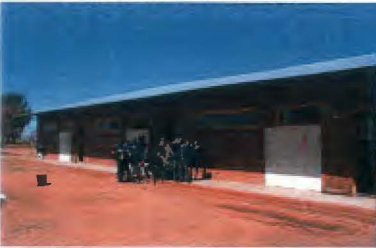
Foto E - Sannasrus Skool