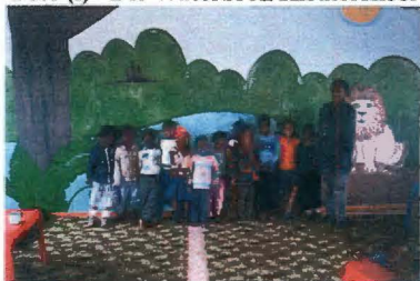
(Sien punt i op die kaart)