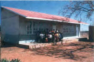
Foto D - Annasrust Skool