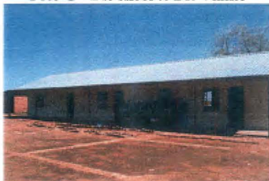
(Sien punt g op die kaart)

Een van die verskillende kleuterskole binne die grense van die NGKA Waterbrongemeente