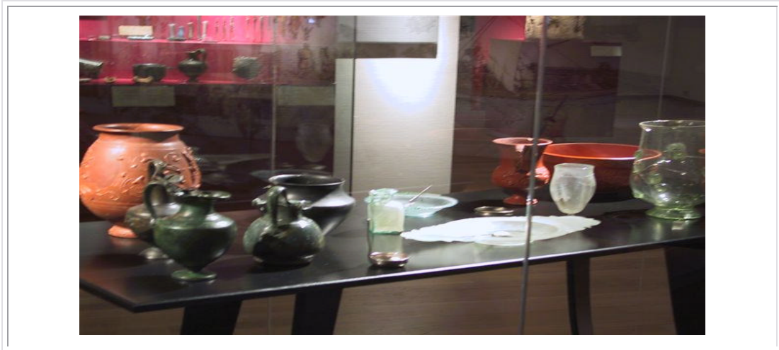
Figuur 1: Piouter- en glasware vir gebruik deur rykes, verkry uit opgrawings in Noord-Gallië oftewel Holland (Rijksmuseum der Oudheden, Leiden).