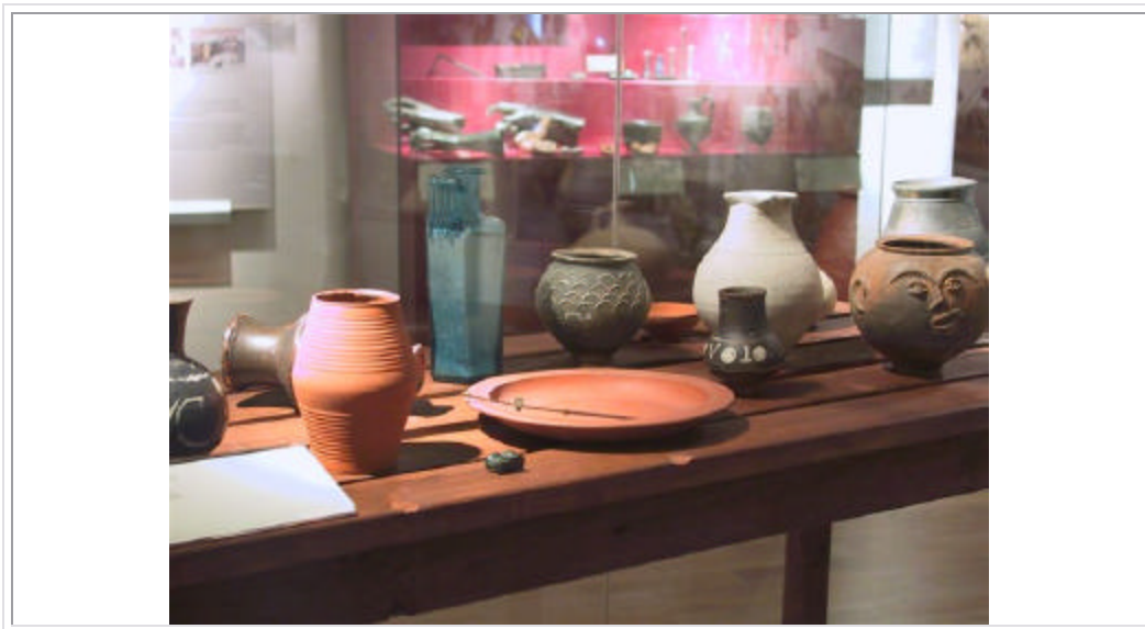
Figuur 2: Tipiese erdewerk vir tafelgebruik, verkry uit opgrawings in Noord-Gallië oftewel Holland (Rijksmuseum der Oudheden, Leiden).