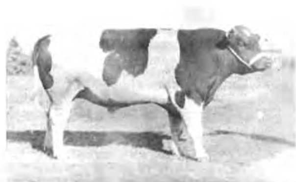
Die Friesbul, Achilles

Die nuwe jaar met sy wyer vergesigte het vir my die hoop weer laat opvlam. 'n Soogdierkundige by die Museum het aangebied om ook by die soektog na die beendere betrokke te raak. Uiteindelik is op 'n knewel van 'n beeskopbeen in die agterste uithoek van die een stoor afgekoni