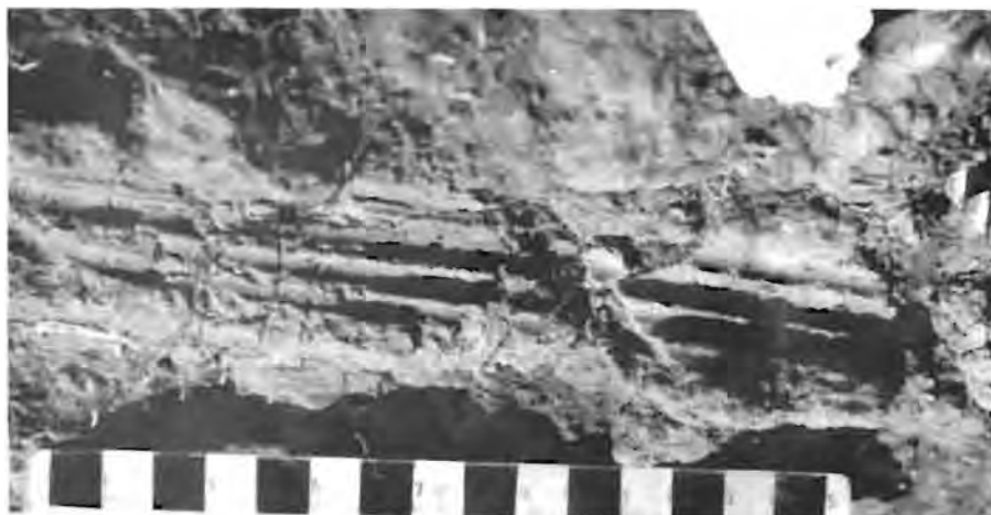
Gebakte klei oorblyfsels van die hut met die afdrukke van riet en gras duidelik sigbaar. Hierdie verskynsels was die eerste aanduiding van 'n ander metode van hutkonstruksie.

Die terrein op Doornpoort 19, naby Winburg, is gedurende 1983-84 noukeurig opgegrawe deur die Departement Argeologie van die Nasionale Museum. Daar is veral gekonsentreer om aktiwiteitsareas bloot te lê en om die vestigingspatroon vas te stel. Die areas waar die daaglikse lewensaktiwiteite plaasgevind het, is onderskeibaar deur die teenwoordigheid van veekrale, kleiner klipstrukture, hutte, kleipotskerwe en ashope. Dit was duidelik dat daar 'n bepaalde orde bestaan wat bepaal het