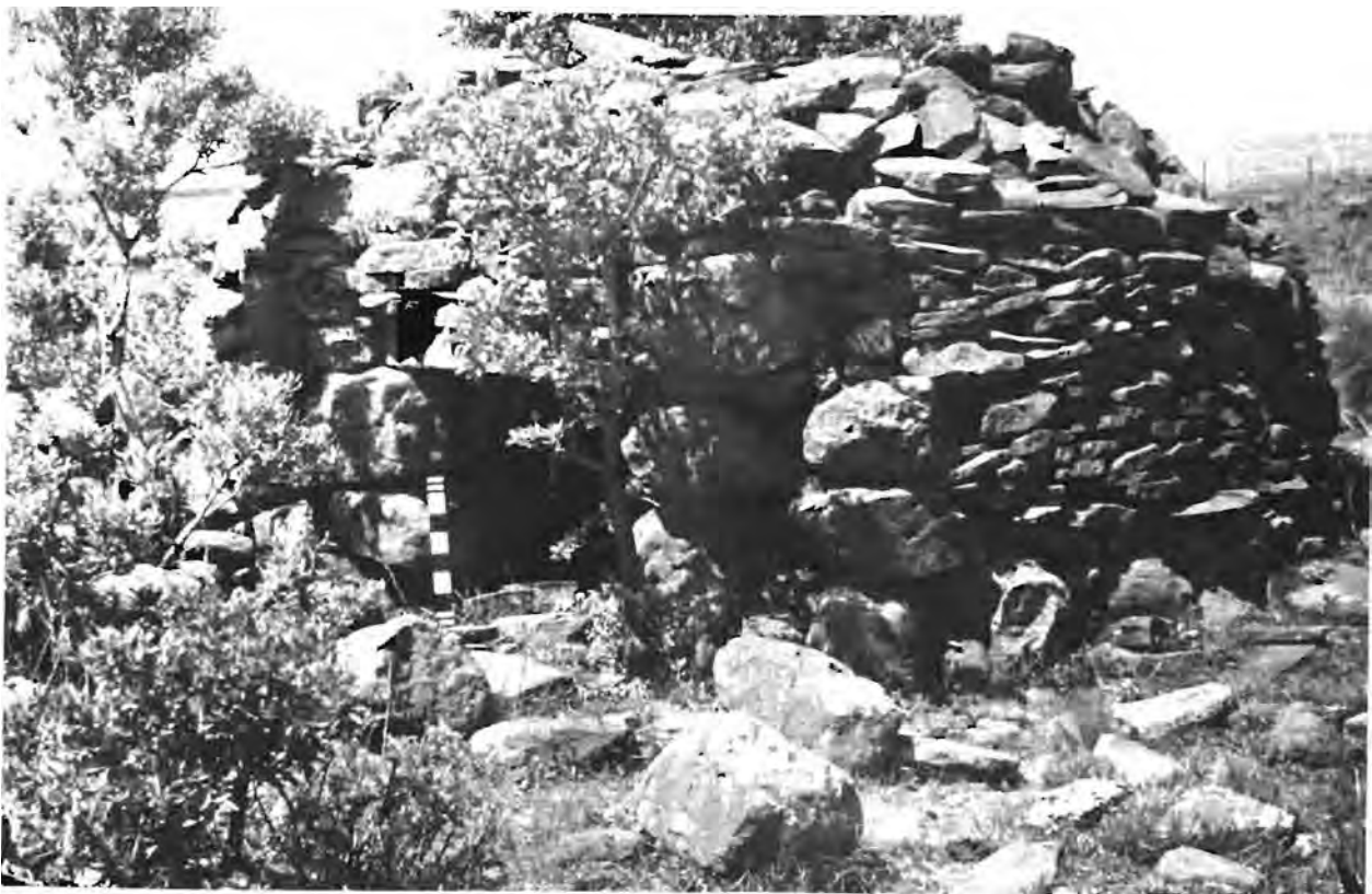
'n Voorbeeld van 'n klipkoepelhut of sogenaamde "Leghoya"-hut. Vroeër is aanvaar dat hierdie die enigste vorm van behuising was. Die navorsing by Winburg het egter duidelik aangetoon dat daar ook ander vorms van hutte bestaan het tydens die bewoning van die klipkraalterreine.