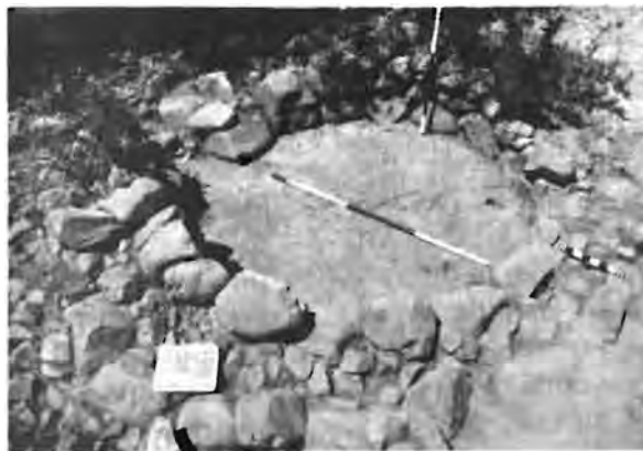
Oorblyfsels van een van die kleiner klipstrukture met die gesmeerde kleivloer duidelik sigbaar.