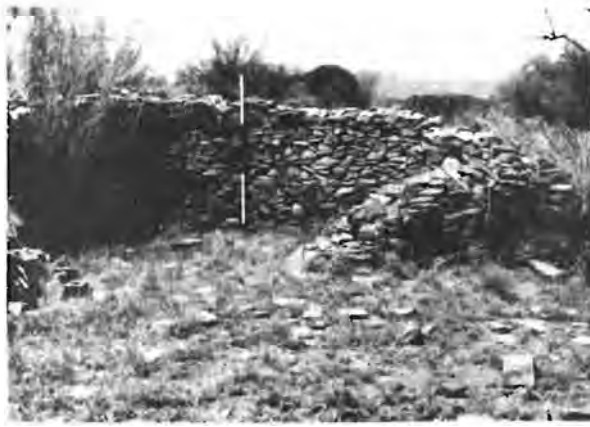
'n Voorbeeld van die klipbouwerk van een van die veekele wat baie goed bewaar gebly het.