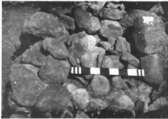
Hier kan duidelik gesien word dat die muur uit drie dele bestaan. Die groter klippe aan die buitekant met die opvulling van kleiner klippe in die middel.