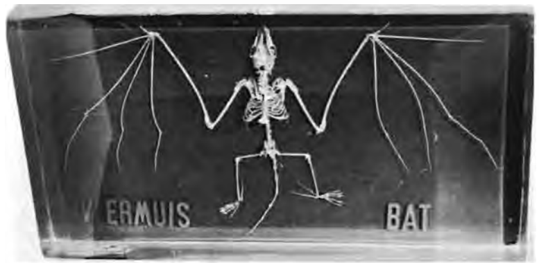
Skelet van 'n vlermuisk ingebed in deursigtige kunshars