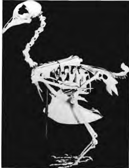
Volledige gemonteerde skelet van 'n duif