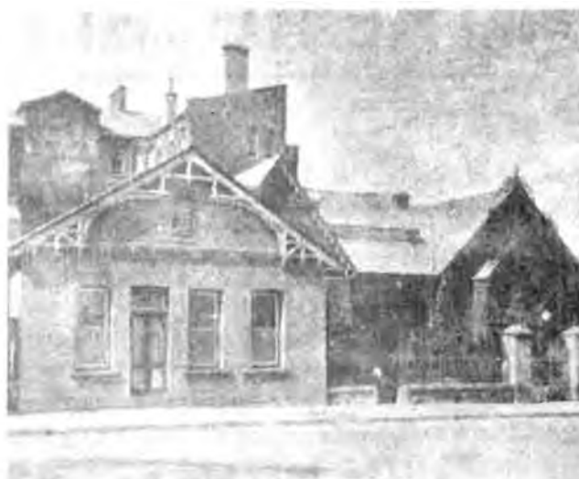
Die Queen's Hotel in 1911, met die Southern Life-gebou in Maitlandstraat sigbaar agter die hotel.