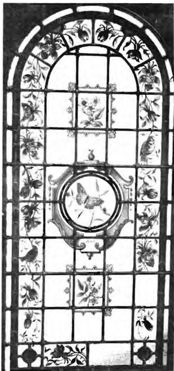
Gebandskilderde glaspaneel (detail)

Die panele wat die ingangsportaal van die eetkamer geskei het, het besonder goed bewaar gebly en slegs enkele van die ruite en loodraampies ontbreek of is beskadig. Kleur- en brandskilderglas uit hierdie tydperk wat nog behoue gebly het, kom in enkele openbare geboue voor, soos bv. die Vierde Raadsaal, die Spoorwegburo en die Ou Presidensie. Wat die panele van die Oranje Hotel betref, is dit seker een van die min gevalle waar dit op so 'n groot skaal in 'n privaatwoning geïnstalleer is. Dit is van die min oorblywende voorbeelde van laat-Republikeinse woninginterieurs.