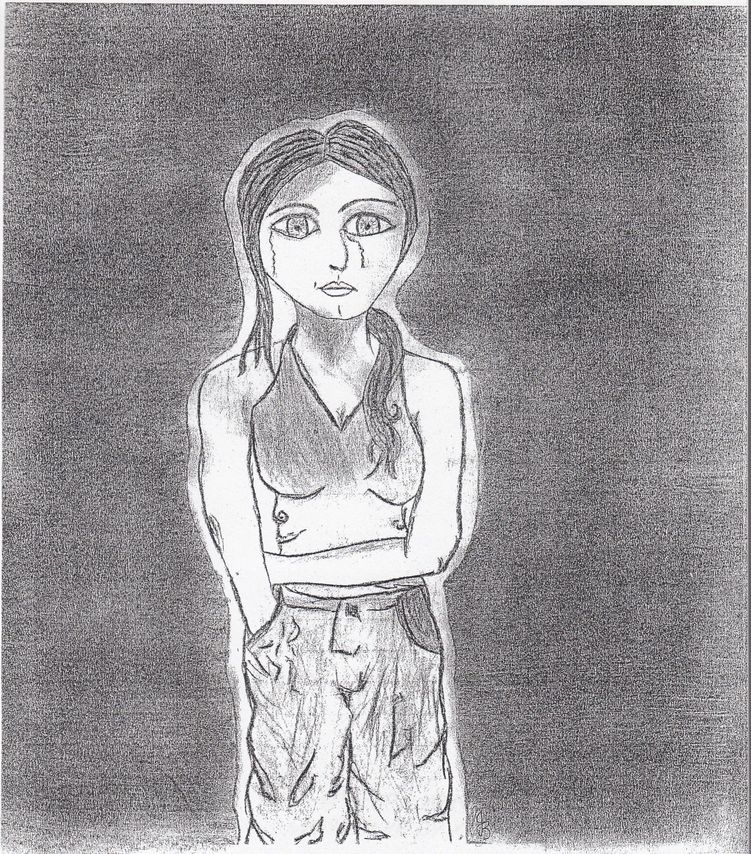
Beskrywende skets van 'n kindersorgskool dogter (geteken deur 'n leerder van Rosenhof Jeugsorgsentrum)