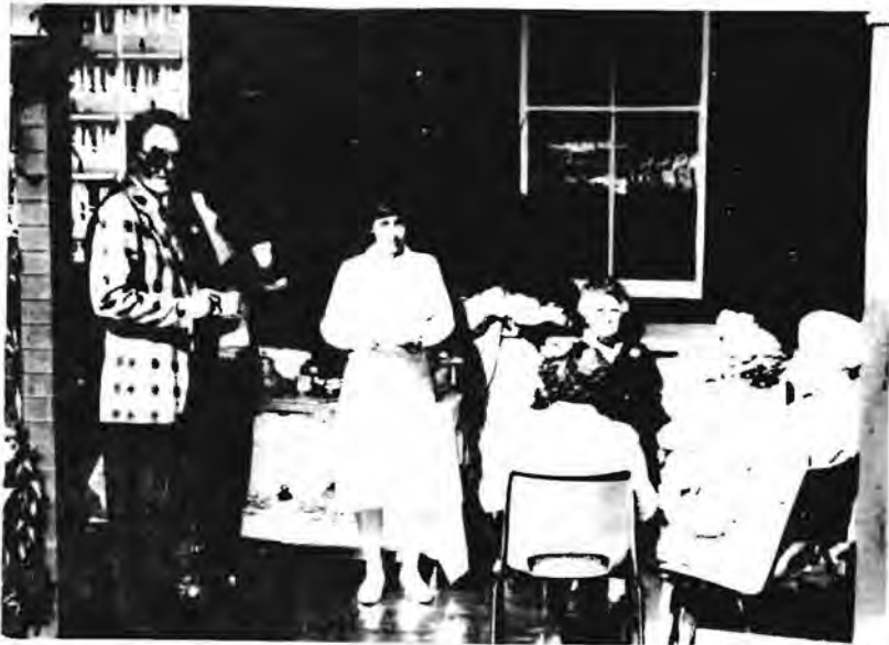
Tee vir bejaardes by Freshford

Die Departement Kultuurgeskiedenis van die Nasionale Museum bied weekliks 'n tradisionele teepartytjie vir inwoners van ouetehuse by Freshford-Huismuseum aan. Die bejaardes word op 'n begeleide toer deur die huis geneem en daarna geniet hulle 'n koppie tee en versnaperinge Pick 'n Pay Hipermark het geskenkbewyse ter waarde van R75-00 aan die Museum geskenk, ten einde die koste van die verversings te help dek.