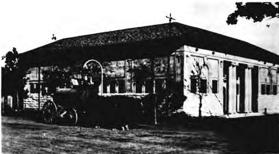
Die nuwe Nasionale Museum kort na voltooiing in 1913. Die Italiaanse teëldak was die eerste van sy soort in Bloemfontein.