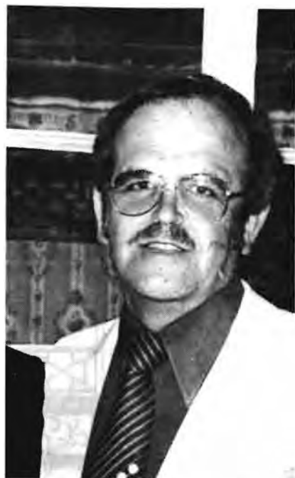
MNR OBERHOLZER IN DIE HOSPITAAL

Miss R. – as she is generally known to the museum staff – has for many years been an active member of the Tree Society of Southern Africa; the Wildlife Society (O.F.S.-Branch); the Botanical Society; and the Orange Free State Arts Society and has served on various committees of these Societies. She is also a member of the Southern African Museums Association, as well as of the Bloemfontein Bird Club since its inception in 1977.