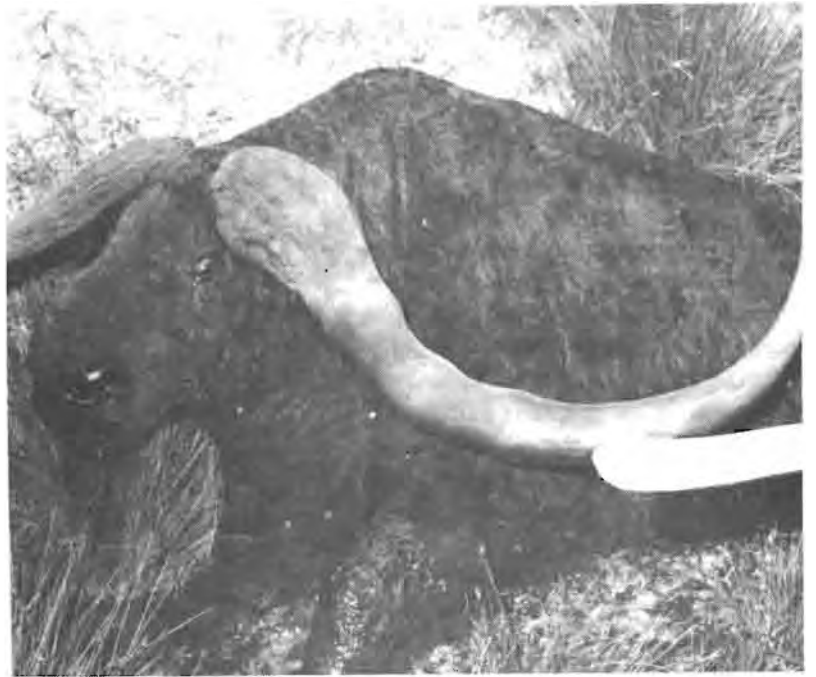
Links bo. Sep se "klei-os", 'n voorstelling van die reusebuffel