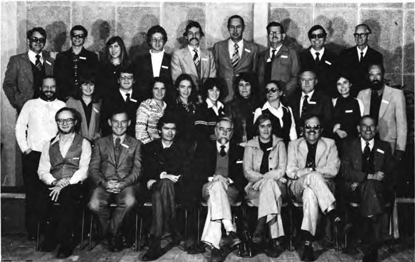
Die Afgevaardigdes van die eerste konferensie van die Paleontologiese Vereniging van Suider-Afrika wat van 2 tot 5 Julie by die Nasionale Museum gehou is.