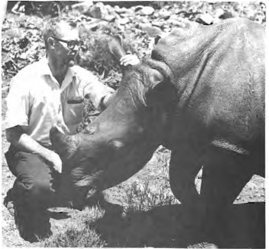
Bo: Sep by die eerste witrenosterreplika (1969).

Sep het veral bekendheid verwerf vir sy verfynde tegniek om glasveselreplika's van diere te maak; hieronder tel witrenosters, seekoeie, krokodille, 'n volwasse olifantbul en die kop van 'n tweede olifant. Gedurende die afgelope paar maande was hy besig om replika's van al die Vrystaatse reptielsoorte, van die likkewaan tot die kleinste geitjies, te maak met die oog op 'n nuwe uitstalling.