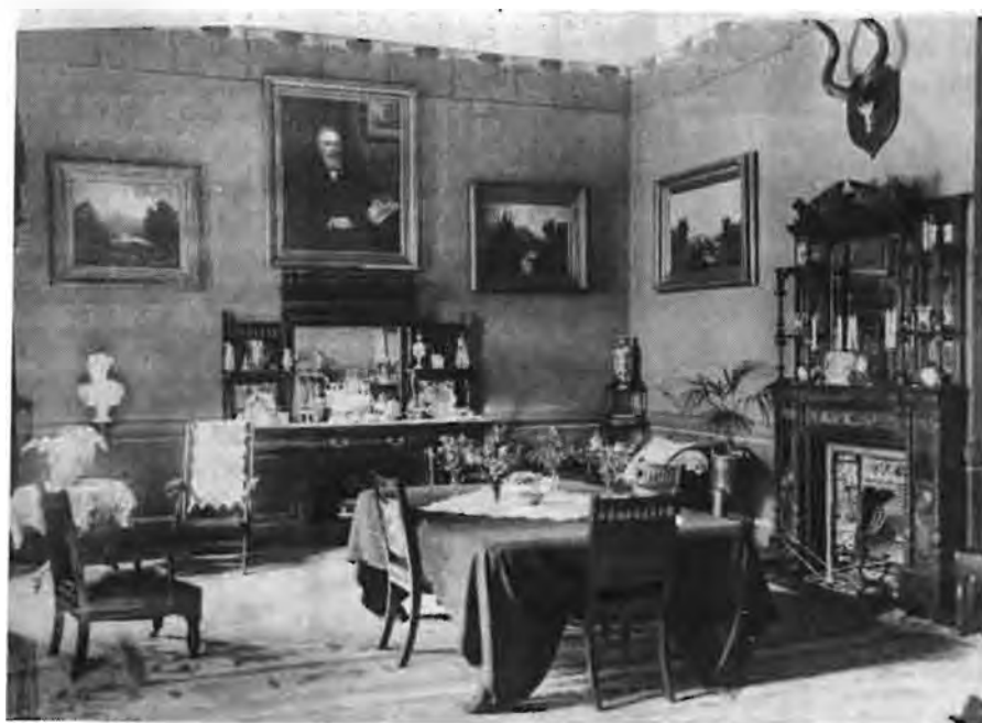
Die eetkamer van 'n tipiese Viktoriaanse huis.