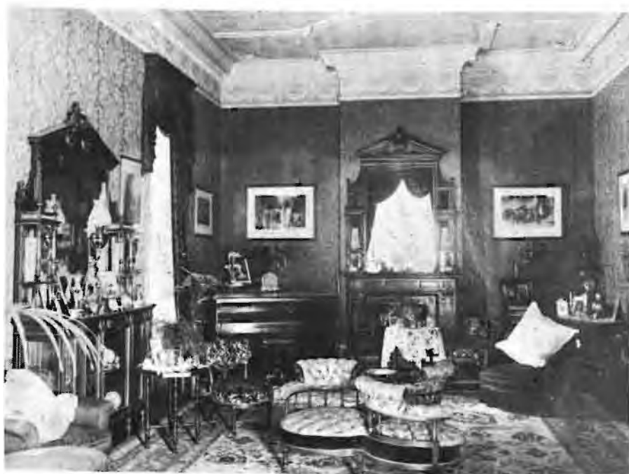
Die sitkamer van 'n tipiese Viktoriaanse huis.