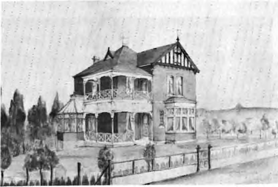
'n Waterverskildery van die huis soos dit na voltooiing daar sou uitsien. Die glashuis is egter nooit gebou nie.

Gedurende 1977 het die Raad van die Nasionale Museum besluit om met die Stadsraad van Bloemfontein te onderhandel omtrent die verkryging van een van die laaste Victoriaanse woonhuise in die stad vir restourasie, bewaring en die inrig daarvan as 'n huismuseum wat oopgestel sal word aan die publiek vir besigtiging. In Maart 1979 het die Stadsraad finaal besluit om hierdie projek te aanvaar en kort daarna is ook die nodige ministeriële goedkeuring verkry. Die Museum het dus nou die vergunning verkry en navorsing gaan onverpoos voort om die geskiedenis van die ou huis na te spoor, omdat daar reeds vroeg in volgende jaar begin sal word met restourasiewerk.