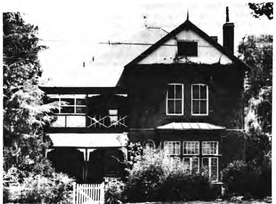
Die huis in 1979 voor restourasie.