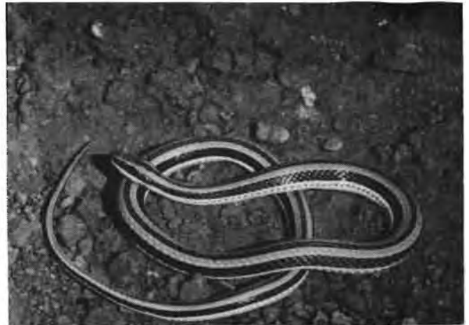
Die Gestreepte Skaapsteeker ( Psammophylax tritaeniatus ).