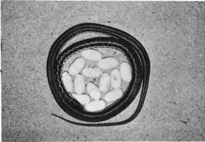
Die Rombiese Skaapsteeker ( Psammophylax rhombeatus rhombeatus ).