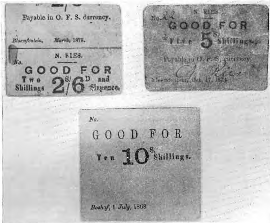
TEKFIGUUR 3. 'n Paar voorbeelde van goedvure uitgereik in die Vrystaat. Ware grootte.