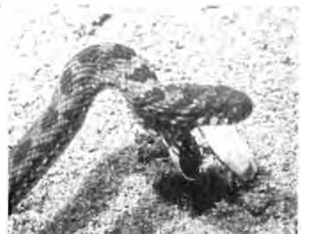
4 Ejection of the empty shell.