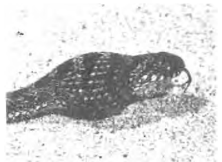
2 Egg in position with the gular "teeth" being brought into action for breaking the shell.