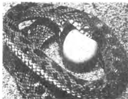
1 Initiation of ingestion process.

Dis egter maklik om tussen hierdie slangsoorte te onderskei. Die nagadder het 'n duidelike V-vormige merk op die kop terwyl die eiervreter 'n soortgelyke merk op die nek het.